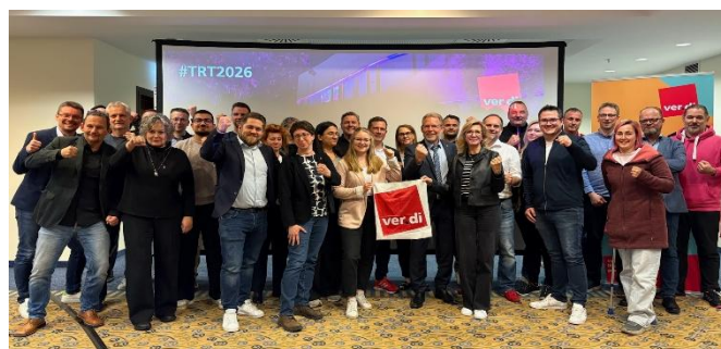
Die ver.di Verhandlungskommission in Bonn

Was uns beschäftigt: Vor Beginn des Iran-Kriegs ging die Bundesregierung von einem